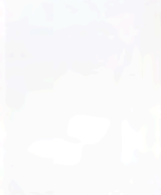
17. Na de tweede stook is het werkstuk klaar.

Voorbeelden van structuren die ik maak. Ik doe dat met houtjes, messen, boomschors, stukken steen, zaden. Soms druk ik de groeven weer gedeeltelijk dicht.