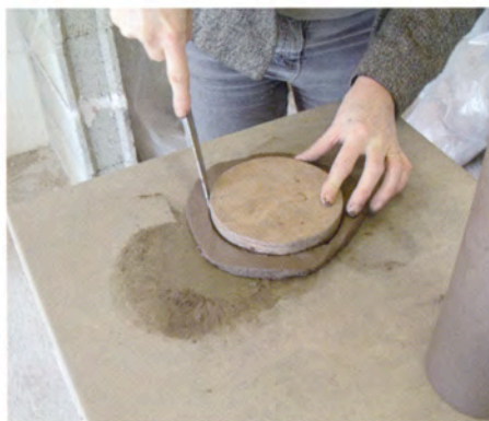
4. Uit een plak klei snijd ik het deksel; daar gebruik ik een ronde houten schijf als sjabloon voor.