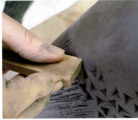
14. Met de punt van een latje druk ik figuren in de klei. 15. Na de finishing touch aan het deksel en de biscuitstook breng ik engobe in de verdiepingen aan. Daarbij gebruik ik een engobe die niet van de biscuit afbladdert; dat kan worden voorkomen door er wat fritte of glazuur aan toe te voegen.