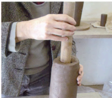
1. Eerst maak ik een cilinder van klei en druk daar van boven een rond stuk hout in.