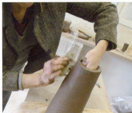
7. Met een lomer maak ik het oppervlak glad.