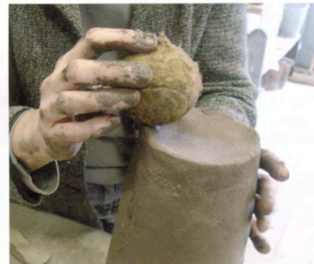
9. Met een tennisbal maak ik de bovenkant hol.