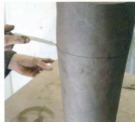
12. Nu begin ik met decoreren: met de punt van een mes trek ik lijnen in het oppervlak.