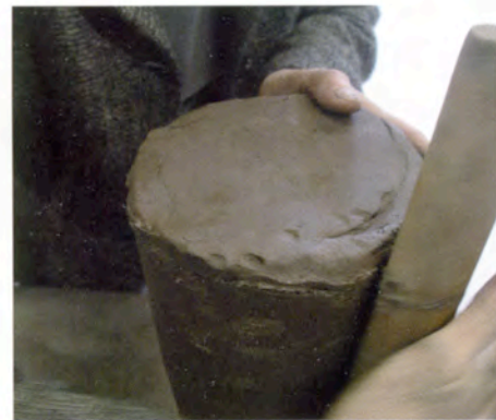
6. Na het monteren rol ik met een rondhout de naden goed dicht.