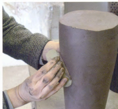
11. ...en met de lomer wordt het oppervlak mooi glad.