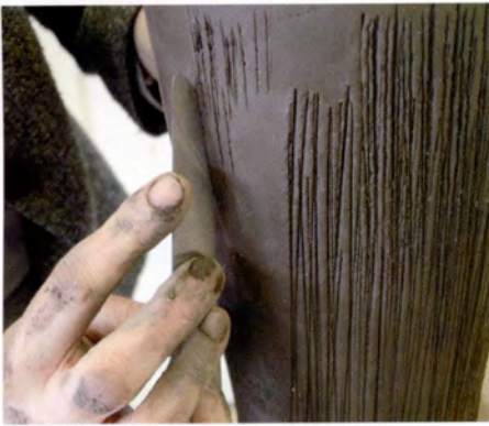
13. Dat kan ook met de vlakke kant van het mes.