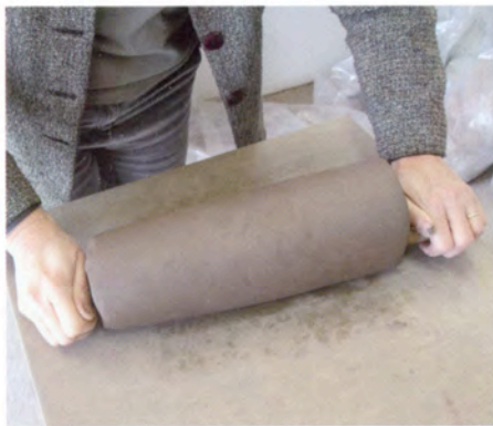
2. Het geheel rol ik over mijn werkvlak, zodat de wand dunner wordt; ik let erop dat ik gelijkmatig druk uitoefen om te voorkomen dat ik een ongelijke wanddikte krijg. 3. Door aan een kant meer druk te geven wordt de vorm conisch.