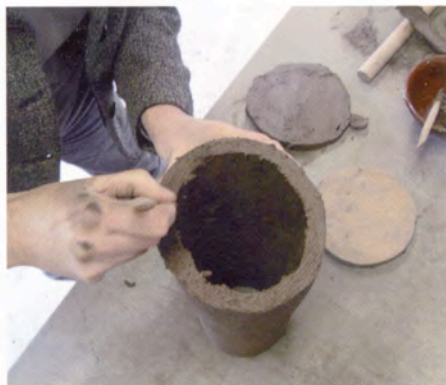
5. Het deksel monteer ik op de cilinder door eerst beide samen te voegen delen in te krassen en met slib in te smeren.