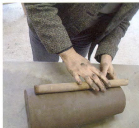
10. Met het rondhout werk ik de wand nog wat meer in model...