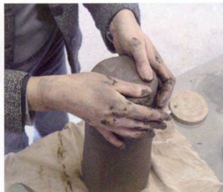
8. Op dezelfde manier als bij het deksel maak ik de bodem aan de cilinder.